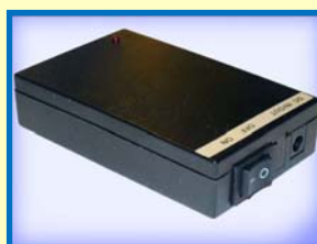
Batteripack 12V 501 033 515