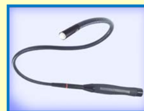
RobiCam 15 501 033 702