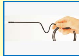
RobiCam 5 501 033 708