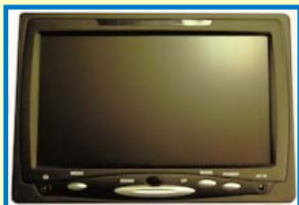
7" bildskärm med inspelning på SD-minne 501 033 108