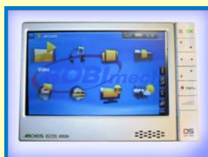
4.3" bildskärm med inspelning på hårddisk 501 033 106