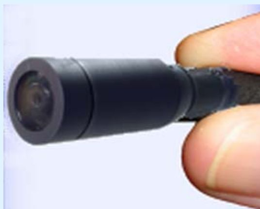
15 mm diameter