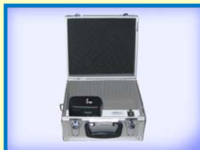
Aluminiumväska med batteri 501 033 502