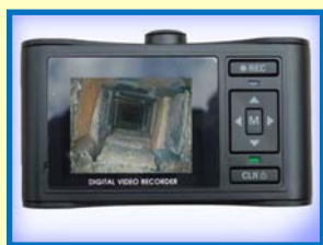
2" bildskärm med inspelning på SD-kort och strömförsörjning till kamera 501 033 107